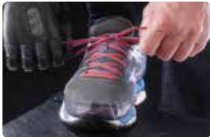
Atarse los cordones de los zapatos