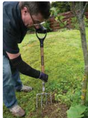
Realizar tareas de jardinería