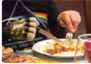
Cortar su propia comida