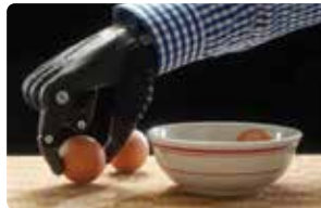
Levantar objetos delicados con cuidado