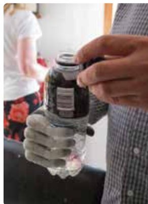
Abrir una botella con facilidad