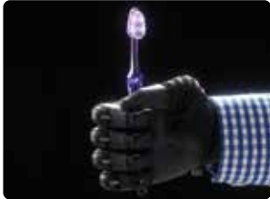
Agarrar objetos finos con firmeza