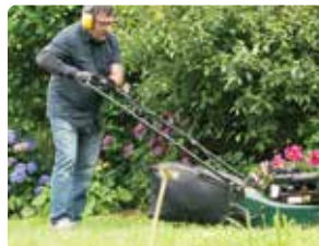
Cortar el césped