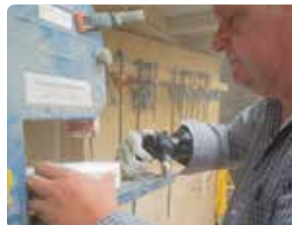
llevar a cabo actividades de apoyo