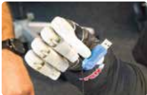
Levantar pequeños objetos con precisión