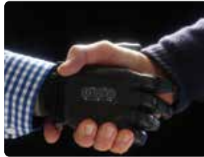
Socializar con confianza