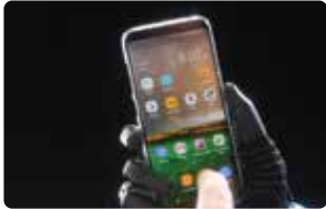
Usar aparatos móviles con facilidad