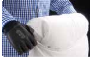
Agarrar ropa de cama