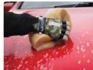
Lavar el coche