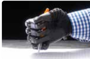
Escribir con un bolígrafo